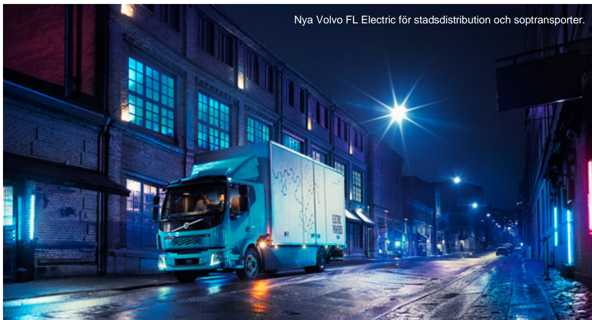
Nya Volvo FL Electric för stadsdistribution och soptransporter.