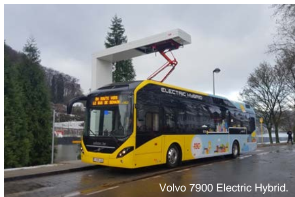
Volvo 7900 Electric Hybrid.

Q1 2017 uppvisade en något svagare europeisk bussmarknad, men med ökat intresse för elektrifierade kollektivtransportlösningar. Den nordamerikanska marknaden var stabil med en bra försäljning av turistbussar och en fortsatt hög efterfrågan på transitbussar. Efterfrågan fortsätter att vara på en låg nivå i Brasilien med hård priskonkurrens. Asien uppvisar en positiv utveckling med tillväxt i Stillahavsregionen.