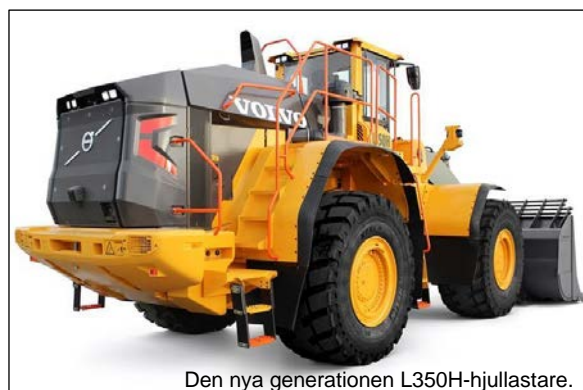
Den nya generationen L350H-hjullastare.